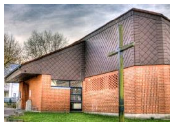
Gemeindezentrum in Kley, Echeloh 74, 44149 Dortmund

Es wird in der Woche vom CJD als Schulungszentrum genutzt. An zwei Wochenenden im Monat steht uns das Gebäude für Gottes- dienste und Gemeindegarbeit zur Verfügung.