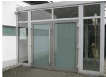
Gemeindehaus hinter der Immanuel Kirche