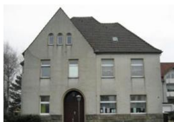
Gemeindehaus in Oespel, Auf der Linnert 16, 44149 Dortmund