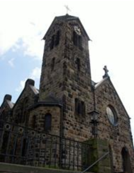
Ev. Kirche in Oespel