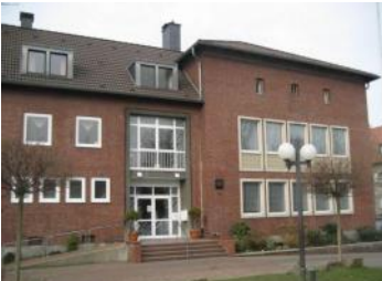
Gemeindezentrum Oberdorstfeld Fine Frau 10, 44149 Dortmund