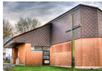
Gemeindezentrum in Kley, Echeloh 74, 44149 Dortmund

Es wird in der Woche vom CJD als Schulungszentrum genutzt. Ein- mal im Monat steht uns das Ge- bäude für Gottesdienste und Ge- meindearbeit zur Verfügung.