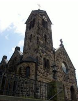
Ev. Kirche in Oespel