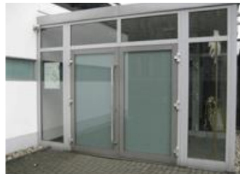
Gemeindehaus hinter der Immanuel Kirche