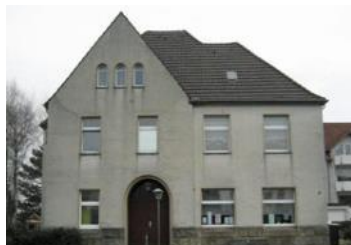
Gemeindehaus in Oespel, Auf der Linnert 16, 44149 Dortmund