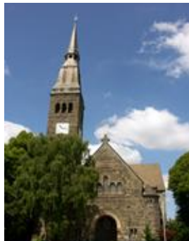
Immanuel-Kirche Marten Bärenbruch 17-19, 44379 Dortmund

Das Gemeindebüro befindet sich im Gemeindehaus Tel. (0231) 619777 Fax (0231) 619703 gemeindebuero @elias-gemeinde.de